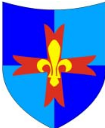
Das Wappen des Stammes